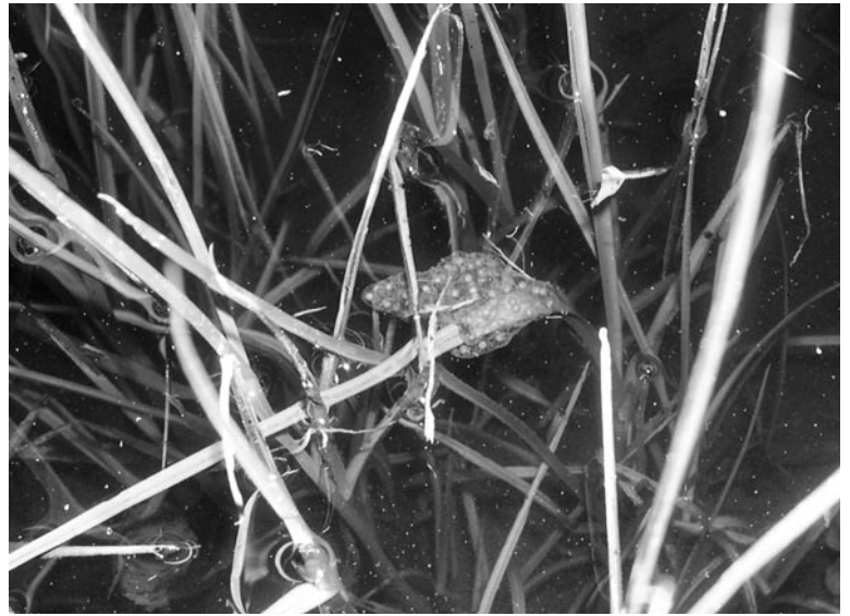
Ponte de rainette