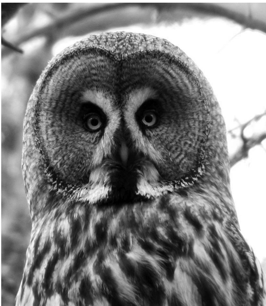
Portrait de Chouette lapone, Suède, Norrbotten. Distance env. 50 m. Kowa 30x, Coolpix 885. Exposition: 1/7 de sec. seulement !

Si jamais l'objet de notre convoitise devait être toujours trop loin à notre