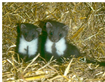
Agées de deux mois

L'histoire de ces deux petites fouines n'est pas banale; elle s'est déroulée entre mars et juillet 1981. La chienne d'une ferme de la région de Divonne, vivement intéressée par quelque chose derrière une palissade, finit par capter l'attention du propriétaire des lieux qui trouve deux petits animaux nouveaux-nés. «Tiens, se dit ce dernier, des chatons! Curieux endroit». Ne connaissant pas les parents et ayant justement une chatte allaitant de tout jeunes chatons,