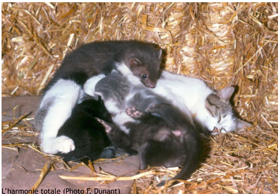
L'harmonie totale