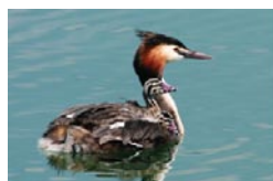
Le Grèbe huppé Muges Plonge et nage sous l'eau, parfois plus d'une minute pour attraper des poissons ou des écrevisses. Il porte ses petits sur le dos pendant quelques semaines.

Une photo et son lieu de prise de vue, une description, la période de l'année propice à l'observation, la taille, l'envergure, le poids et la longévité.