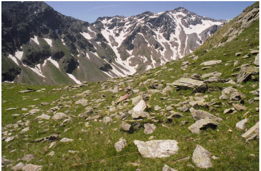
Carré permanent utilisé pour l'étude de la végétation sous l'influence du réchauffement climatique.

La conférence montrera quelques exemples de recherches effectuées qui ont permis d'étudier l'impact déjà observable du réchauffement climatique sur la flore des Alpes. La longue tradition botanique de notre pays, avec des inventaires très précis remontant au début du XX e siècle, nous offre des données extrêmement