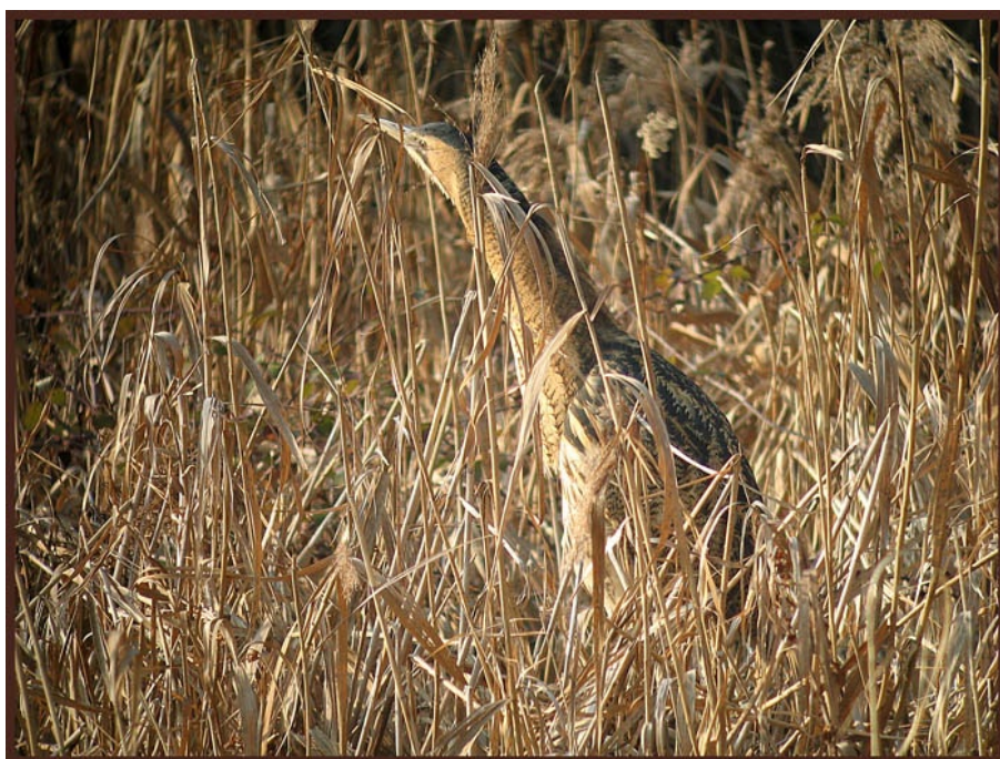
Pointe-à-la-Bise, février 2009