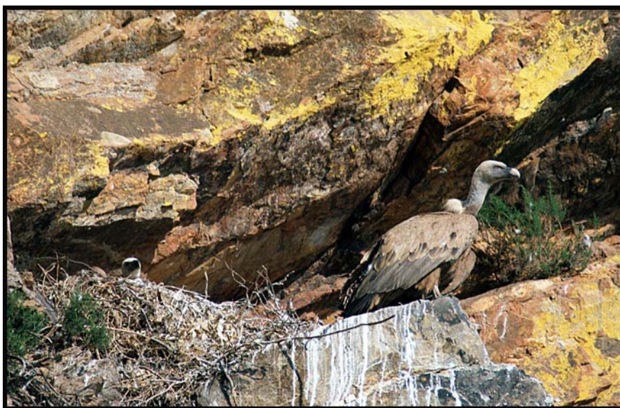
Extremadure, Monfragüe, mai 2001

Neuf vautours fauves sont morts le 19 juillet sur la commune d'Aulon dans les Hautes Pyrénées. Les vautours ont été retrouvés à proximité d'un cadavre de vache euthanasiée par un vétérinaire, et les analyses toxicologiques commandées par les services du Parc national des Pyrénées ont révélé que la mort des vautours