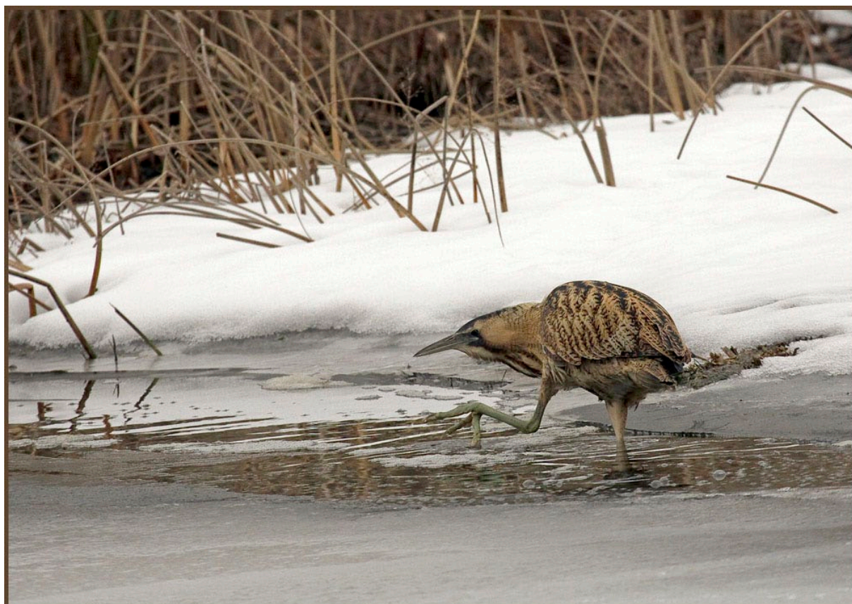
Le 20.01.2010 au Marais de Champs-Pittet Butor étoilé Botaurus stellaris Canon EOS 40D + zoom EF 100-400mm F4.5-5.6 IS USM