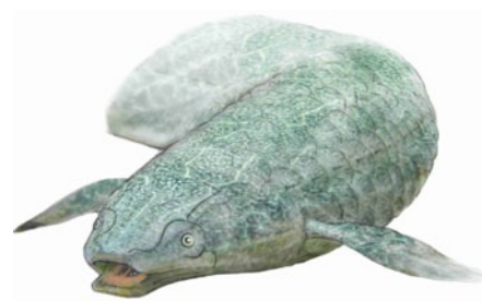
Reconstitution du dipneuste fossile ( Ferganoceratodus martini ) découvert dans le Crétacé inférieur (140 millions d'années) de Thaïlande. ©Lionel Cavin

Cette découverte fournit des arguments inédits en faveur de la protection des dipneustes. Selon Lionel Cavin et Anne Kemp, «il faut dorénavant considérer ce poisson comme un véritable fossile vivant faisant partie de notre patrimoine mondial de la biodiversité». Il apparaît aujourd'hui particulièrement urgent de protéger Neoceratodus forsteri , cette espèce australienne endémique d'environ 120 cm de long qui est fragilisée du fait qu'elle ne (sur)vit plus que dans quatre petits bassins hydrographiques de la région de Brisbane (Queensland). Pour préserver l'unique dipneuste australien, il est donc indispensable de gérer au mieux l'aménagement et l'exploitation des cours d'eau des alentours de Brisbane, une zone en forte croissance et parmi les plus densément peuplées d'Australie.