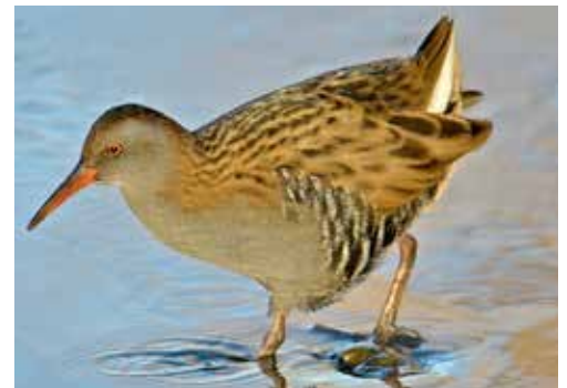
Photo de Râle d'eau

(Re)-découvrons ce site à travers les conférences.