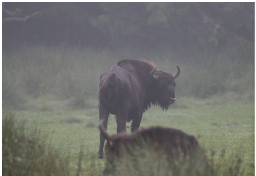
Bientôt dans le Jura...

Un petit groupe de personnes motivées et engagées veut concrétiser la vision de bisons d'Europe en liberté dans l'arc jurassien. Cependant, les bisons d'Europe ne peuvent pas revenir librement en Suisse comme le cerf, le sanglier, le loup et l'ours. Il faut réintroduire le bison d'Europe, comme cela a été fait par le passé avec le bouquetin, le castor et le lynx. Plusieurs projets exemplaires de réintroduction du bison d'Europe ont été réalisés en Pologne, Lituanie, Allemagne, Roumanie, Pays-Bas, etc. Les temps sont opportuns pour le retour du bison d'Europe.