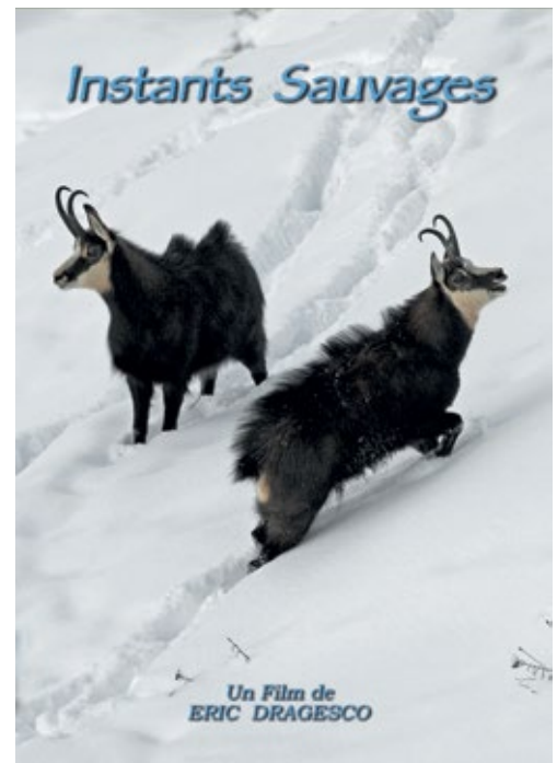
Jaquette du DVD Instants Sauvages

Ce film nous fera revivre des comportements étonnants et quelques instants parmi les plus sauvages de la faune de montagne. Ordre du jour de la 71 e Assemblée Générale de la SZG