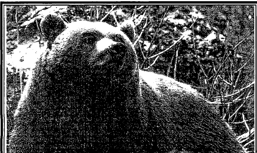
Ours brun (Ursus arctos), photo ©Artus

Selon Robert Hainard, Mammifères sauvages d'Europe