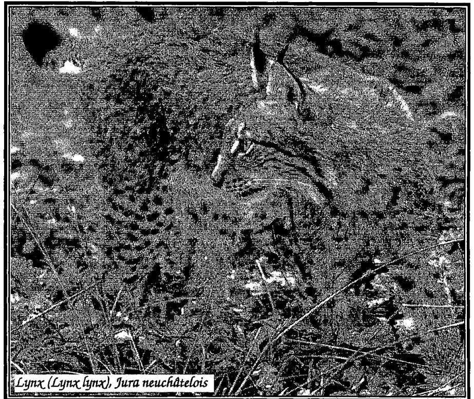
Lynx (Lynx lynx), Jura neuchâtelois

Vérifiez bien le lieu et l'heure du rendez-vous. Inscrivez-vous au moyen du talon ci-contre, au moins une semaine à l'avance en courrier A et... n'oubliez pas de téléphoner la veille au soir au 735 25 02