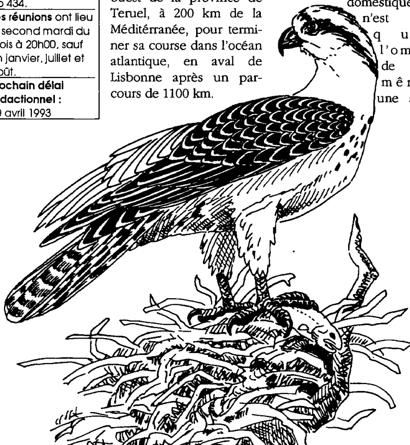
Balbuzard pêcheur ( Pandion haliaetus )

Ces mêmes hommes se sont émus de voir le colosse à genoux et veulent lui créer un parc national dans le secteur où il trace la frontière entre l'Espagne et le Portugal. Mais le fleuve a décidé de prendre sa revanche, grâce à un vieux complice : le Balbuzard pêcheur. Il y a des années que ce rapace ne niche plus dans la péninsule, mais depuis toujours quelques individus reviennent y passer l'hiver. Or voilà que l'on commence à revoir des adultes en été, pêchant dans les secteurs les plus tranquilles de leur ami le Tage. Certains ornithologues le soupçonnent même de nicher incognito sur son ancien territoire. Le balbuzard va peut-être revenir en famille sur le grand fleuve. Dès lors, le Tage tiendra sa revanche.