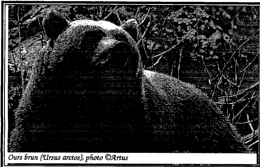
Ours brun ( Ursus arctos )

Selon Robert Hainard, Mammifères sauvages d'Europe